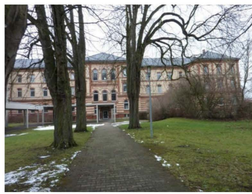
Schulgebäude: Ehemalige japanische Schule in Bad Saulgau